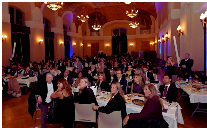
Vue de la soirée